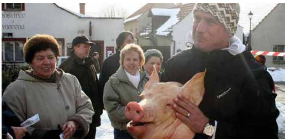
Vzpomínka na masopustní oslavy v roce 2010