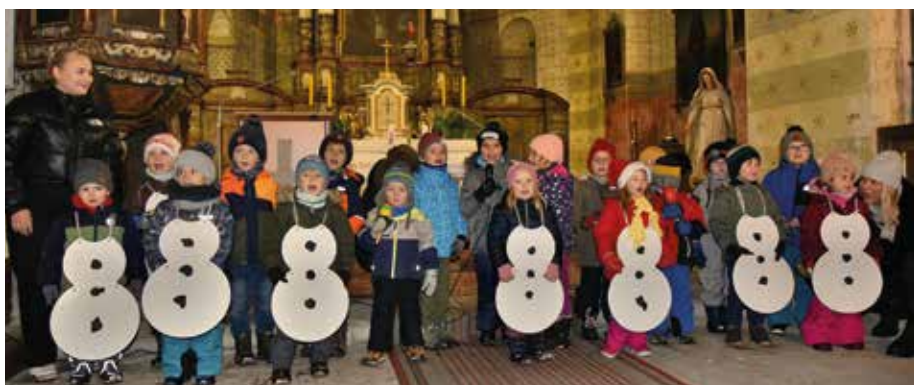
Vystoupení dětí MŠ