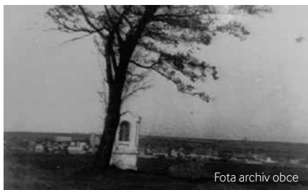
Původní kaple Panny Marie Na Pískách

Motivoval a potěšil mě tehdejší první krok k nápravě – obnova Všetatské pěšiny. Kdysi zaniklá cesta se stala oblíbenou trasou pro pěší, běžce i cyklisty. Dnes už si snad ne-