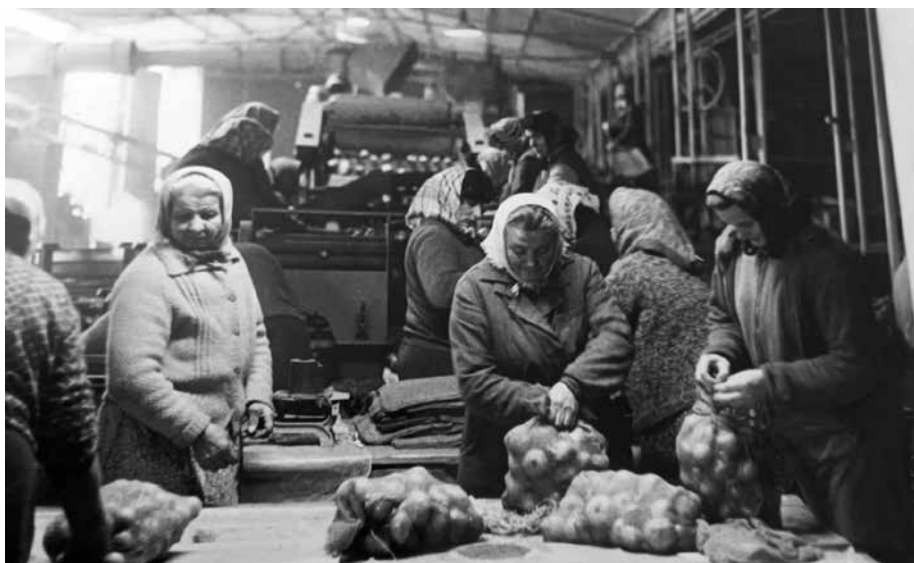
Pracovnice JZD třídí cibuli