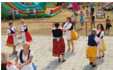
Setkání rodáků, 2015

V dalších letech jsme navštívili Josefův Důl, Růžovou, Děčín – Maxičky, odtud jsme parníkem vyjely do německých lázní Bad Schandau na příjemné vykoupaní, dále