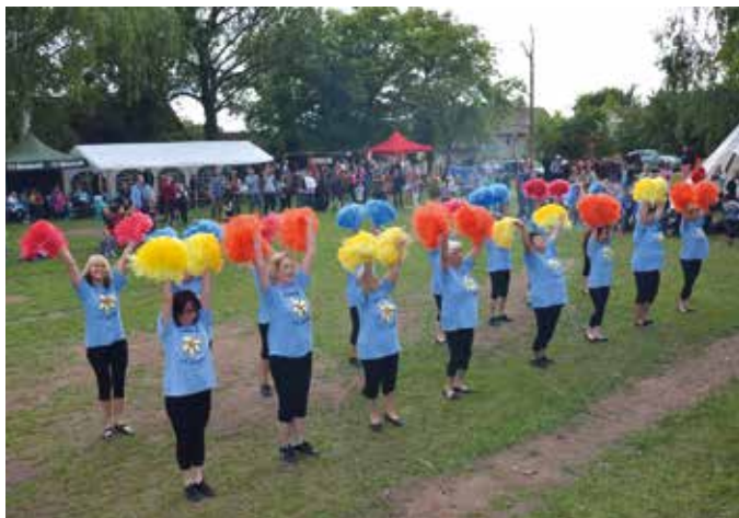
Dětský den, 2015