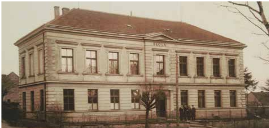
Budova školy navržena a postavena v roce 1899 – 1900

Je tomu už 25 let, kdy byl odkryt základní kámen skoro sto let staré školy. V něm pak byla uložena neporušená schránka s dobovými dokumenty.