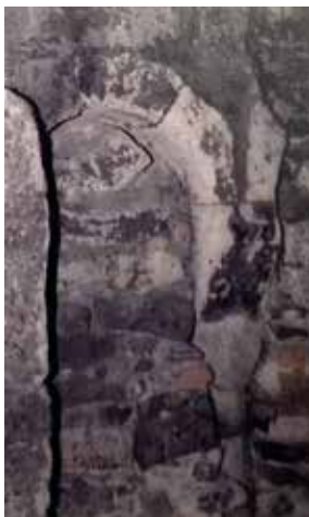
Zazděné románské okno ve věži

Pro Čečelice byly velice významné roky 1911 a 1912, protože se začalo s rozvodem elektrického proudu po obci. 9. března 1912 se již svítilo. V obci bylo instalováno 29 světel a ve 175 obytných domech se ten den rozsvítily první žárovky. Spolu s obcí